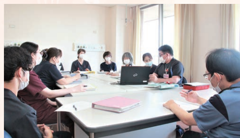
DSTによる会議の様子