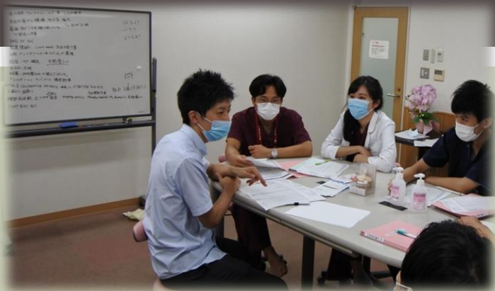
月1回開催の名大総合診療科勉強会