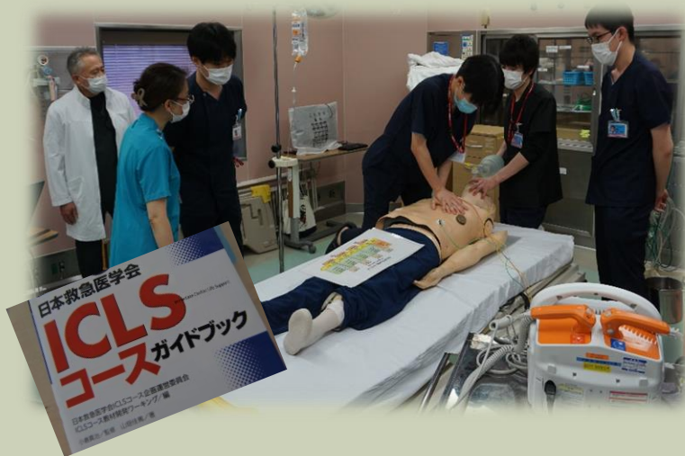
院内でICLS講習会も開催