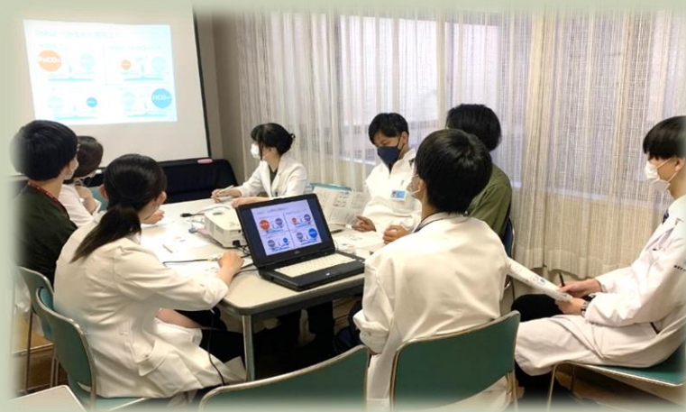
研修センターでの指導医からの救急症例勉強会