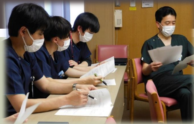
当直前勉強会（臨床研修センター長）